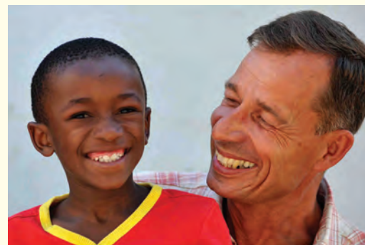
LUTZ EN AYAKHA