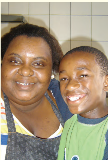
AYAKHA EN MAMMA SINAZO