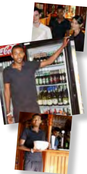
WAT ALS EEN VAKANTIE BAANTJE BEGON IS NU EEN VASTE JOB