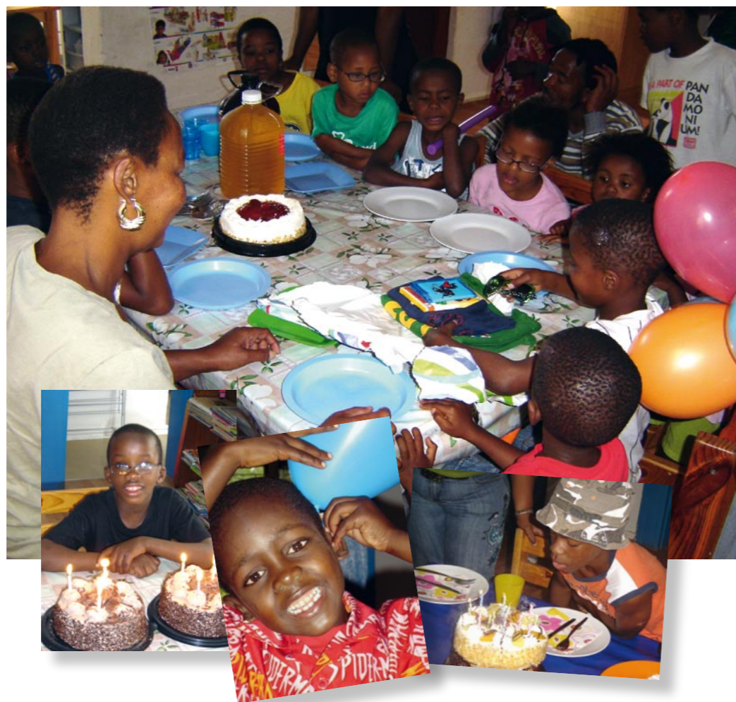
Verjaardag vieren bij HOKISA.

“Je zou de kinderen 's ochtends eens moeten zien, als ze naar school gaan, trots in hun schooluniform. Het is zo'n mooi gezicht.”