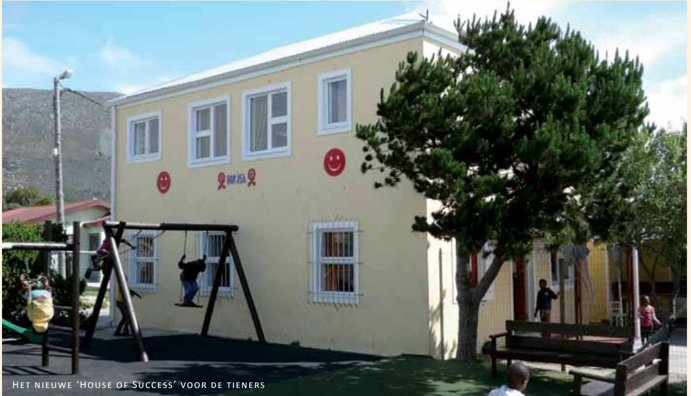
HET NIEUWE 'HOUSE OF SUCCESS' VOOR DE TIENERS

HOKISA biedt een thuis voor kinderen in Zuid-Afrika die ouderloos of ziek zijn als gevolg van Hiv/Aids.